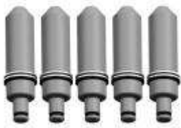
9M3136-2 Pernos d. 24 mm, longitud 100 mm serie de 5 piezas (Solo para brida FC3, FC4 e FC5)