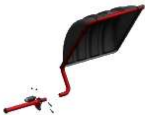
3M700 Protector (Solo para V551, V552, V553 e V554)