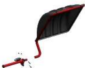
3M700-1 Protector (Solo para V555)