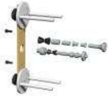
3M1092-8 AMSF-HD TS