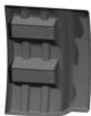
2M3102 Protector anti salpicaduras en ABS (Para todas las equilibradoras con sistema de medición externo) (De serie en V652, V642 e B441)