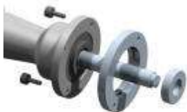
3M3043 Kit distanciador para HD PL