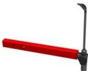
Sistemas de medida y accesorios

Disponibles para todos los modelos de Equilibradoras (excepto B201)