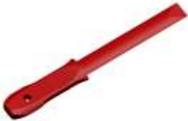
9M3223 Espátula de plástico Para quitar contrapesos adhesivos