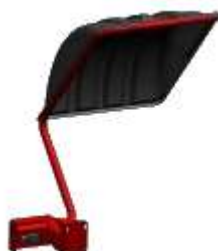
3M600 Protector (Solo para B304.S, B305.S, B306.S, B306.G2.S, B325.S, B326.S, B331.S, V585.S)