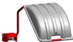
Protectores de rueda