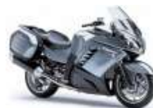
Adaptadores de moto