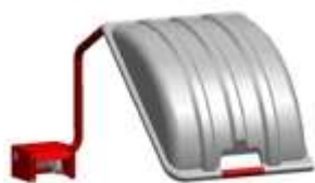
3M563 Protector (Solo para B211 e B221)