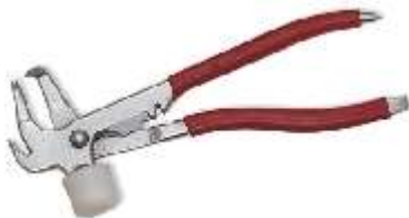
9M1343.002 Pinza Para contrapesos en llantas de aluminio con cabezal plástico