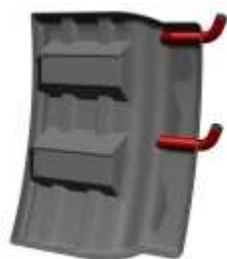
3M3102 Protector anti salpicaduras en ABS (Para todas las equilibradoras con sistema de medición externo) (De serie en V653, V643)