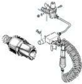
3M2564-1 KVP Kit tuerca de apriete neumática + alimentador