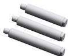
A. 2M2144-2 Eje roscado 165mm, eje de \varnothing 38mm (de serie en equilibradoras con eje basculante) B.2M2144-1 Eje roscado 190mm eje de \varnothing 38mm (de serie) C.2M2144-3 Eje roscado 225mm eje de \varnothing 38mm (de serie en equilibradoras de camión)