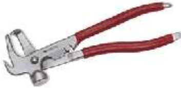
9M1343 Pinza Para contrapesos estándar