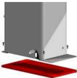
3M3028 Base para Balatron 2000 (B201-B210-B211-B221) Base para evitar la fijación al pavimento (completa con tornillos de acoplamiento a la máquina) Peso neto kg. 25