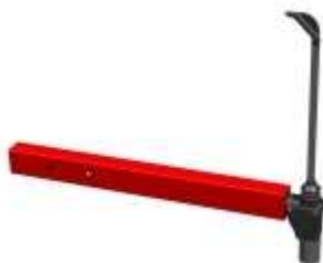
3M748.001 D Sistema de medición exterior (x V555 desde matrícula E56009081150 y V585 desde matrícula E56106090441)