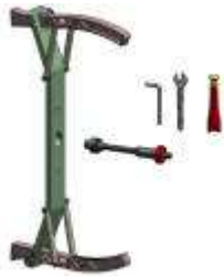
3M671.001 AMSF-HD.38 Pro Bike-2 para ejes de ø 38mm Brida para ruedas de motocicleta (1 eje de 14 mm + adaptadores + 4 conos diámetro mín- máx 14-33mm) (diámetro externo rueda min-max 400-790mm)