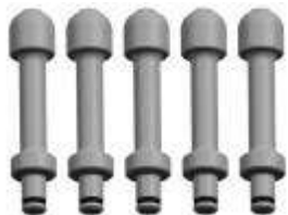
9M3136-4 Pernos d. 24 mm, longitud 92 mm serie de 5 piezas (Solo para brida FC3, FC4 e FC5)