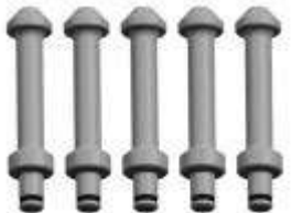
9M3136-3 Pernos d. 24 mm, longitud 92 mm para llantas de aleación Porsche serie de 5 piezas (Solo para brida FC3, FC4 e FC5)